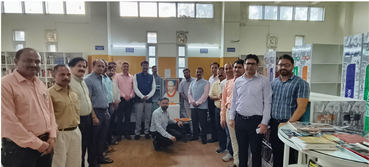
5: User Awareness Program on National Digital Library of India and NDLI Club Organized on September 21, 2023