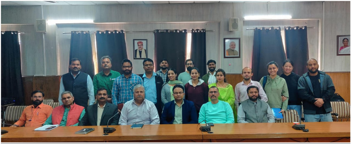
8: Team Acharya Raghuveer Central Library offered prayers to Knowledge and Wisdom Goddess Maa Saraswati today to mark the auspicious occasion Vasant Panchami on 14 Feb 2024